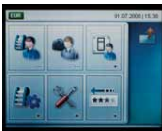
примеры индикации цветного сенсорного экрана