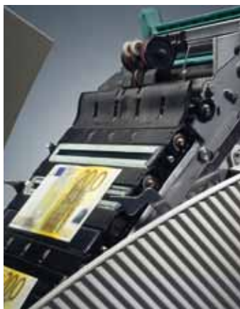
Датчик CashRay 180 — сканирование всей поверхности банкноты

будь то в центральном банке, будь то в приходной кассе.