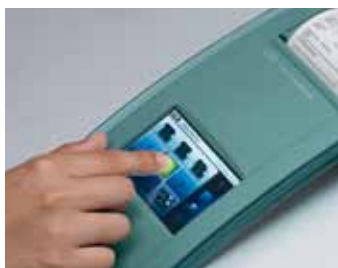
Интуитивное обслуживание ускоряет рабочие процессы