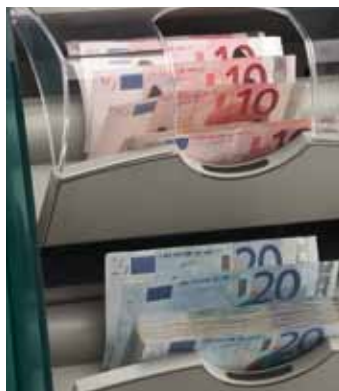
Компактное решение для самых различных видов применения

Свыше 30 лет G&D является мировым лидером в области высокопроизводительных систем обработки банкнот. Продукция и решения концерна G&D это — залог эффективности процессов подсчета, проверки подлинности, сортировки, упаковки и уничтожения банкнот.